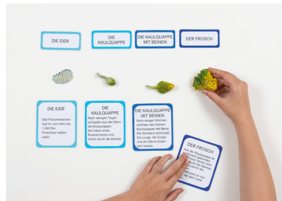
Quelle: www.bel-montessori.at , weitere Bezugsquellen siehe unten